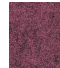
St Martins CUZ1X