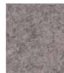
St Andrews CUZ86