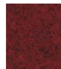
Edge Hill CUZ90