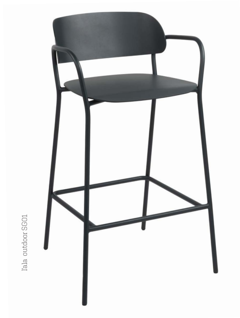
l'ala outdoor SG01

In addition to its lightness and suitability for outdoor use, aluminium was chosen for its sustainability, perfectly matching the objectives of circular economy.