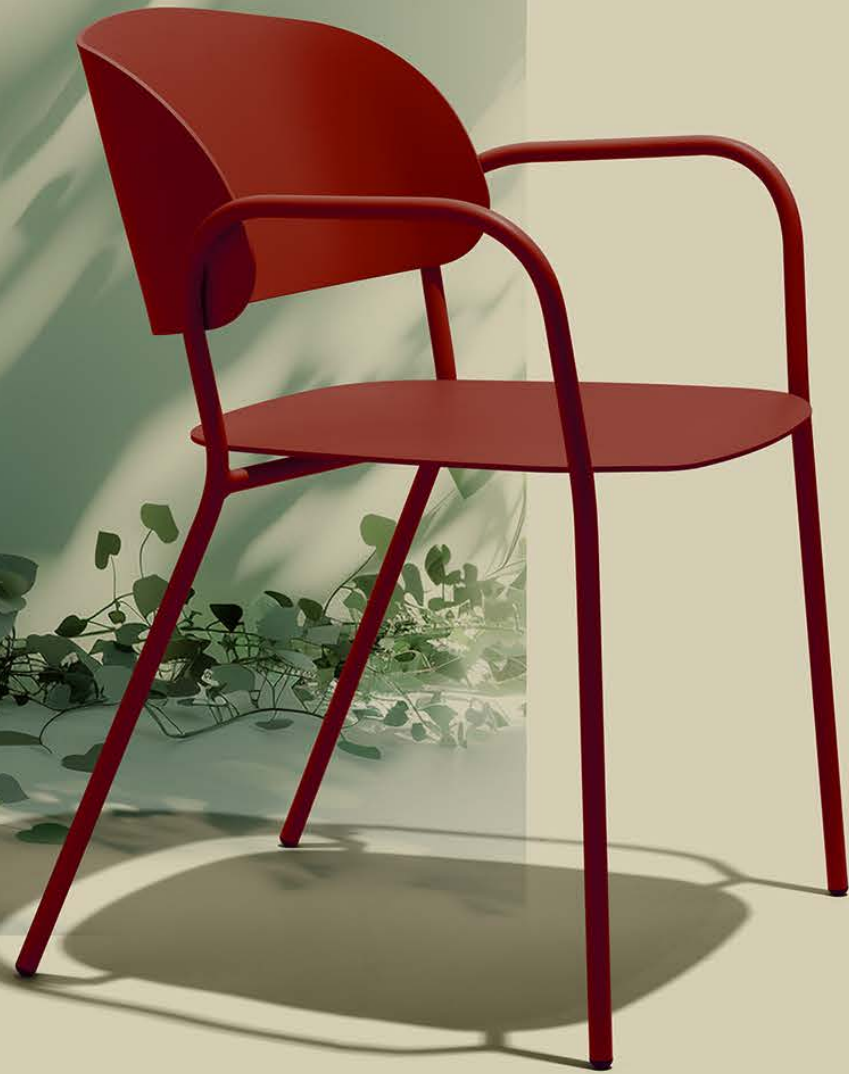
l'ala outdoor P001

The collection in recycled aluminium is produced in Italy, and manufactured in a technologically advanced machining centre, giving complete freedom of design. Single programming and one-stage processing allows for innovative solutions, reducing the number of components and simplifying the production process thereby minimising start-up times and waste. In creating its new outdoor collection, New Life, expert in working with wood, has identified an opportunity for innovative metalworking technology that takes advantage of all these resources, that is competitive compared to traditional processing.