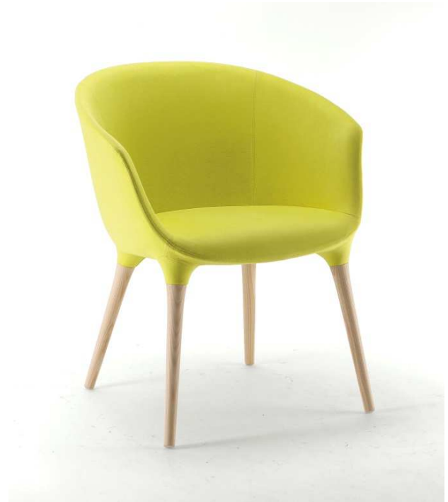
Dimensioni / Sizes (cm) A

Soft and welcoming lines combined with refined care for details, such as the visible stitching displaying customised tailoring quality, make Spring a truly special chair. The particular feature that immediately captures one's attention is the natural fusion between the shell and the elegant legs available in various materials that create an indissoluble link.